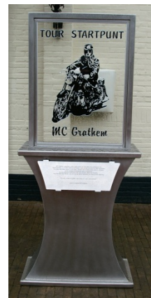
Zuil Tourstartpunt MC Grathem

Dus loop eens binnen en laat je verrassen door een route in de mooie omgeving van Limburg.